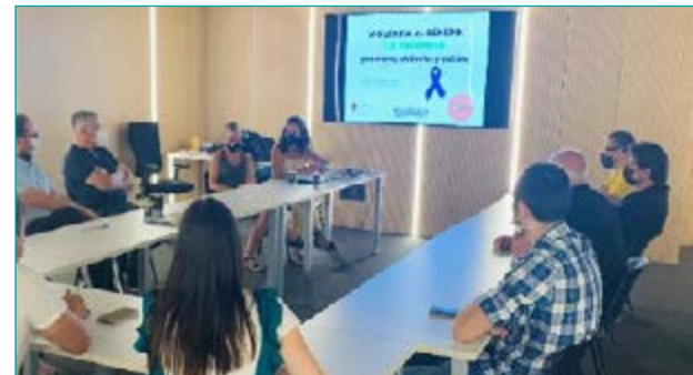
Jornada de formación en Igualdad en Grupo Orenes

Grupo Orenes ha implantado cuatro Planes de Igualdad en diferentes sociedades, con medidas específicas en materia de 'Prevención contra el acoso y la violencia de género', y tienen el compromiso de actualizar y mejorar el 'Procedimiento y protocolo de prevención contra el acoso'.