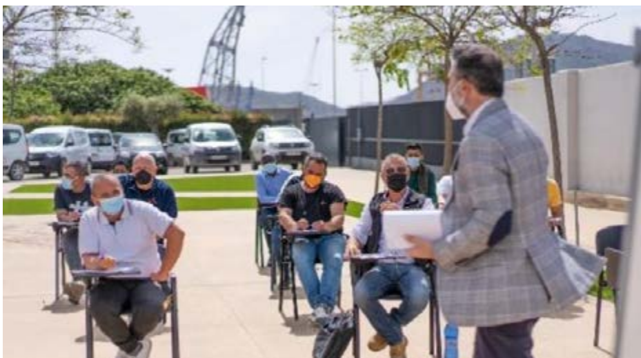
Sesión de formación en ética social en Interempleo

Las iniciativas implantadas por Interempleo durante 2021 incluyeron la difusión de campañas publicitarias de la Consejería de Mujer, como la del Juguete no Sexista, bajo el lema “Cuando eliges un juguete estás educando. Tú elección es importante”. En el epígrafe formativo, se programó una jornada en materia de igualdad a la que le siguieron sesiones centradas en ética profesional, cuyos temas principales fueron la igualdad y el acoso en el ámbito laboral, problemas que afectan en todos los niveles de las empresas.